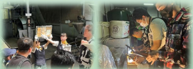
大高醤油株式会社を ガイドする生徒たち