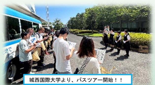
城西国際大学より、バスツアー開始！！

今回は、一般の方を招いてのツアーを実施する上での事前学習として、城西国際大学の留学生を対象としたバスツアーを実施しました。