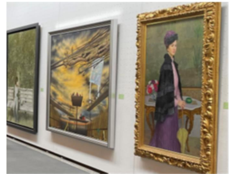
昨年度の県展の様子

プロの芸術家と同じ展覧会で展示される貴重なチャンスです。ぜひ、チャレンジしてください。